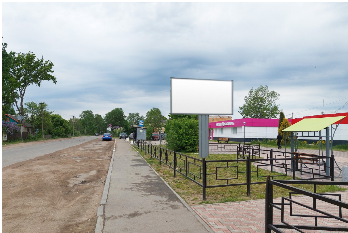
Место расположения рекламной конструкции

Адрес предполагаемого места размещения рекламной конструкции: Кингисеппский р-н, пос. Усть-Луга, кв. Ленрыба, у д. 35Б, газон, правая сторона Тип и размер предлагаемой к установке рекламной конструкции: Двусторонний щит – билборд 6,0х3,0 м