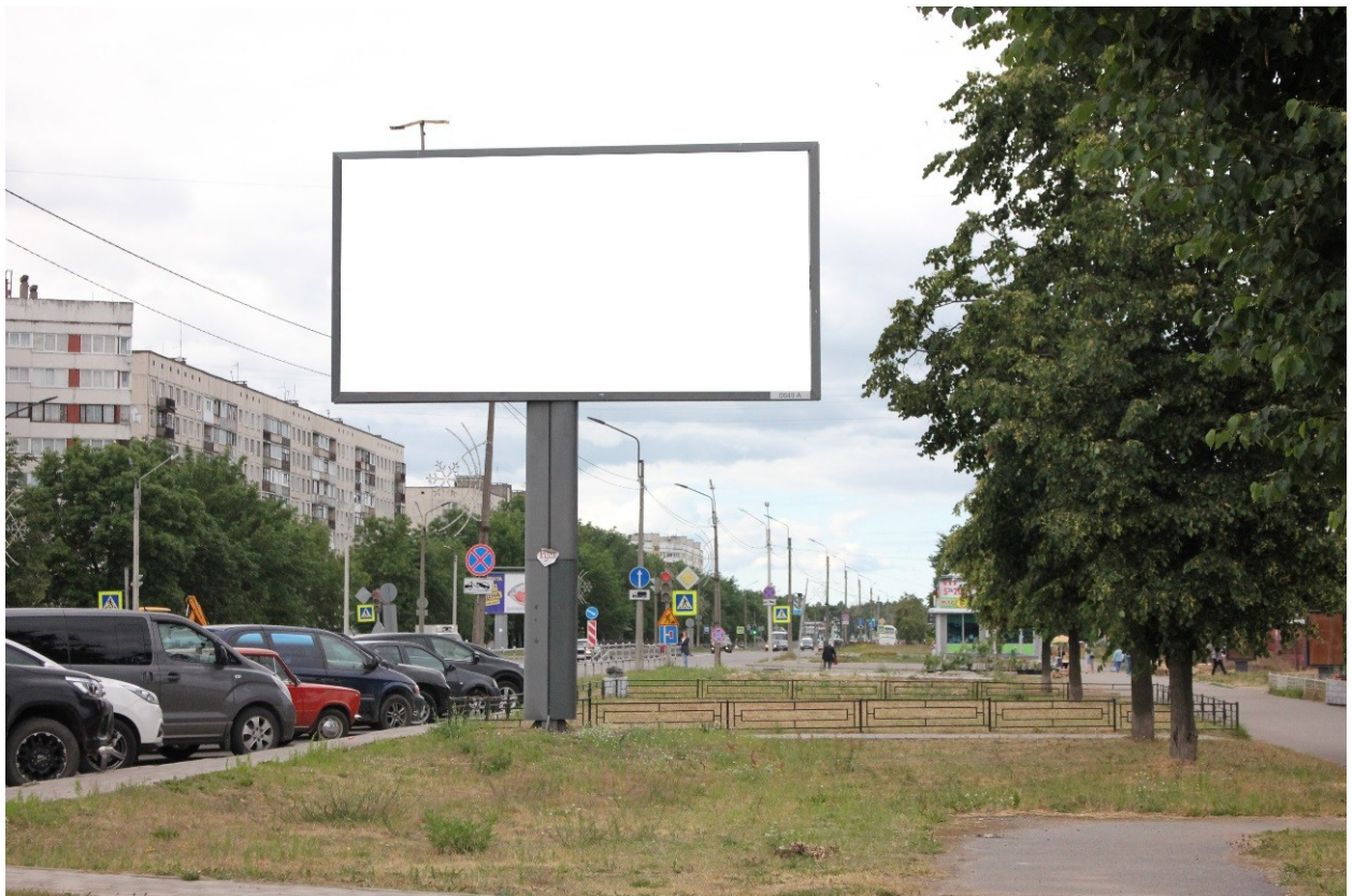
Фото места размещения