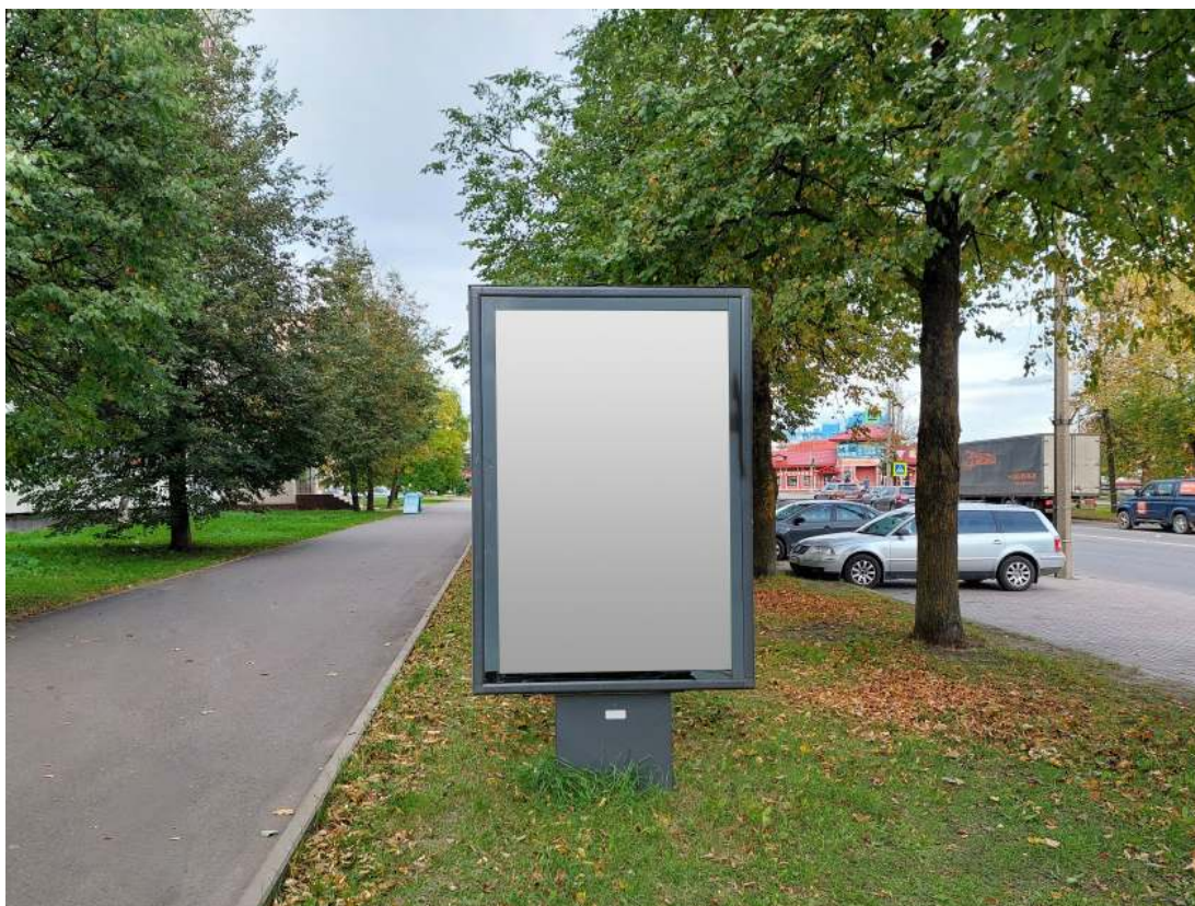
Место расположения рекламной конструкции