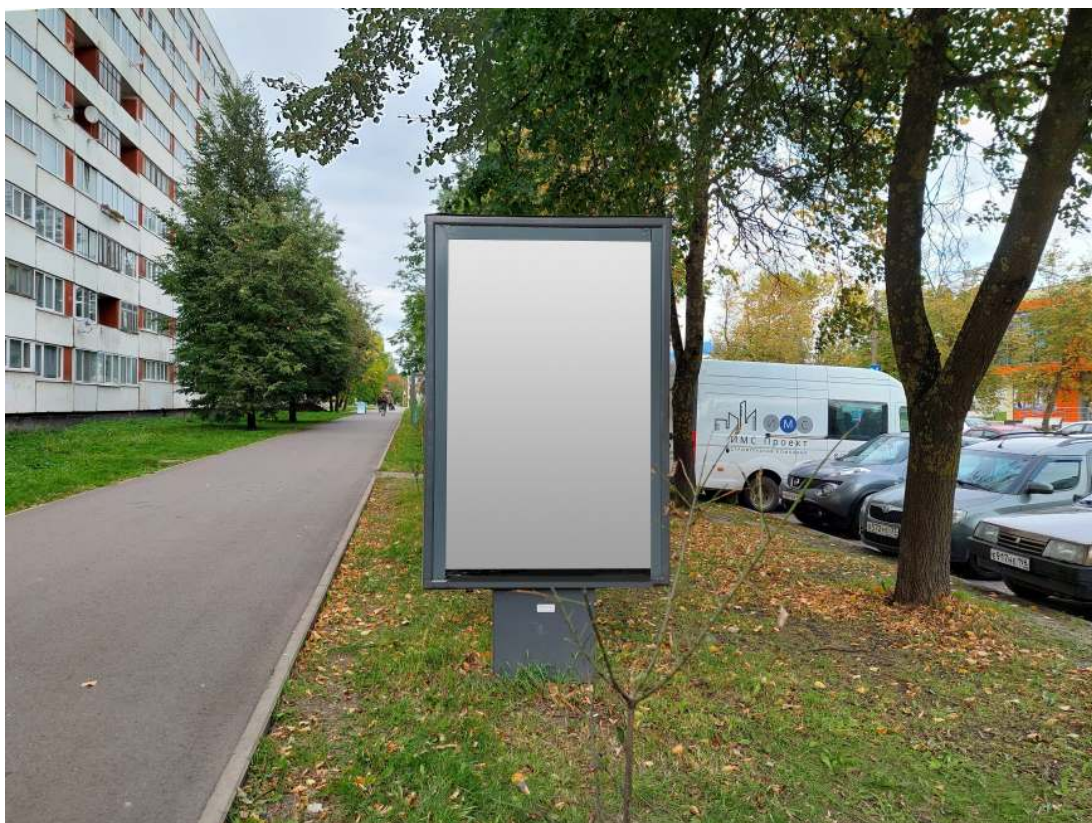
Место расположения рекламной конструкции