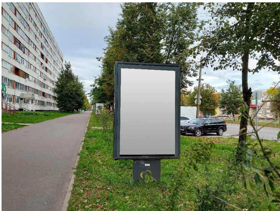
Место расположения рекламной конструкции