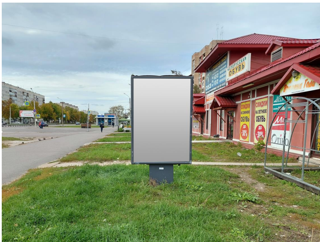
Место расположения рекламной конструкции