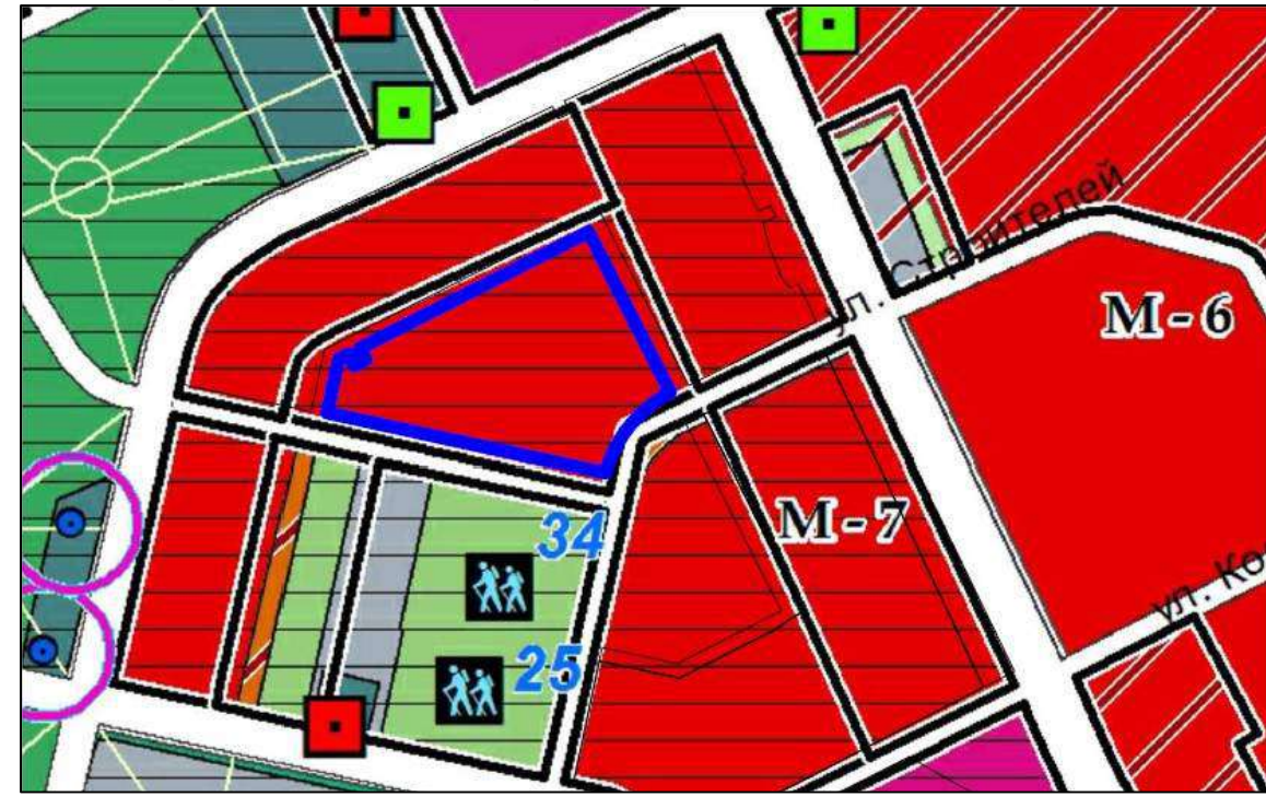
Выкопировка из карты функционального зонирования Генерального плана поселения

Предоставление разрешения на отклонение от предельных параметров разрешенного строительства, реконструкции объектов капитального строительства для земельного участка площадью 27 083 кв.м. с кадастровым номером 47:20:0902003:604 с видом разрешенного использования «Дошкольное, начальное и среднее общее образование», расположенного по адресу: Ленинградская область, Кингисеппский муниципальный район, Кингисеппское городское поселение, г. Кингисепп, в части сокращения минимального отступа от границы земельного участка