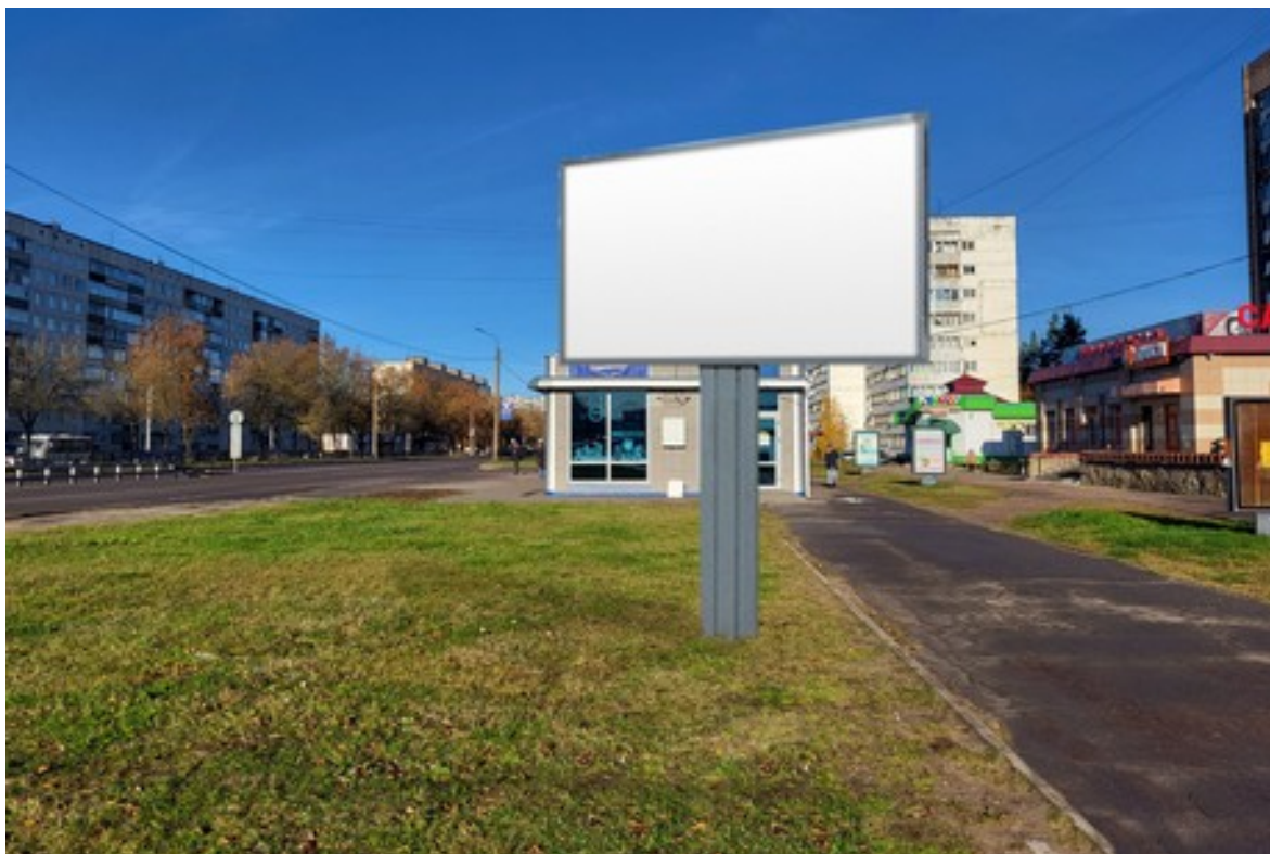
Место расположения рекламной конструкции

Тип и размер предлагаемой к установке рекламной конструкции: Односторонний щит – билборд (светодиодный экран) 6х3 м