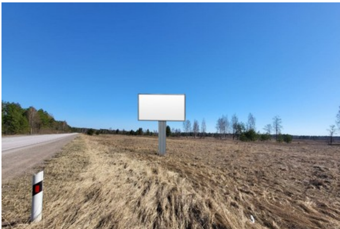
Место расположения рекламной конструкции

Тип и размер предлагаемой к установке рекламной конструкции: двусторонний щит – билборд формата 6,0 x 3,0 м