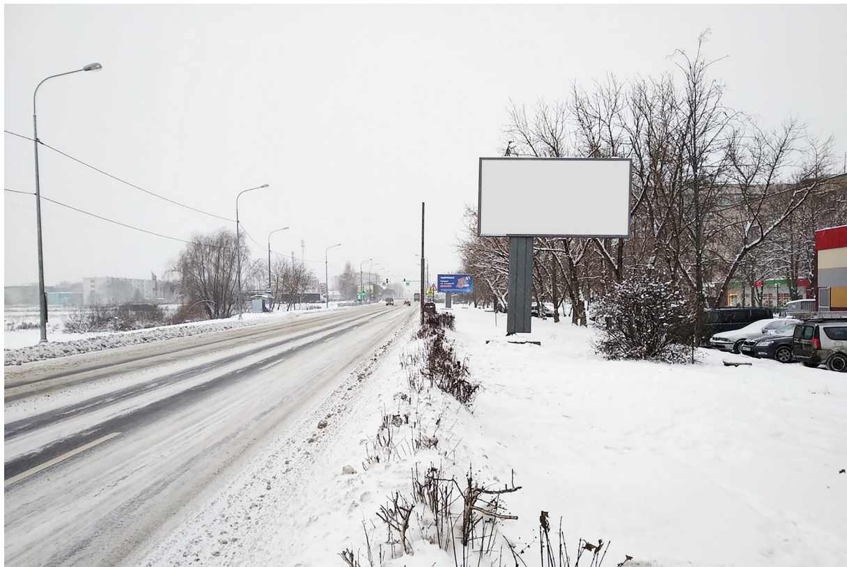
Место расположения рекламной конструкции

Тип и размер предлагаемой к установке рекламной конструкции: отдельно стоящий двусторонний щит – билборд 6х3 м