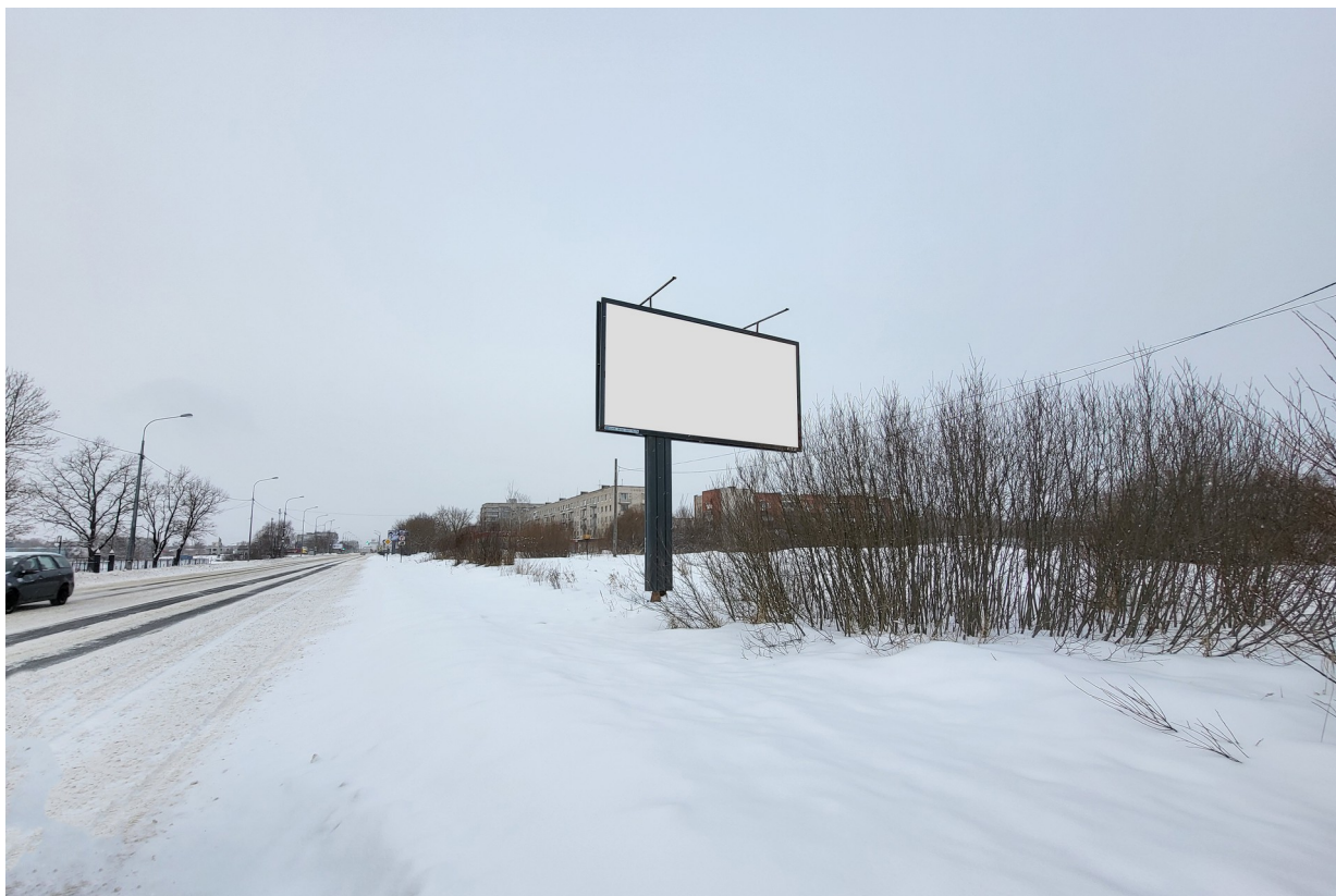
Место расположения рекламной конструкции

Тип и размер предлагаемой к установке рекламной конструкции: отдельно стоящий двусторонний щит – билборд 6х3 м