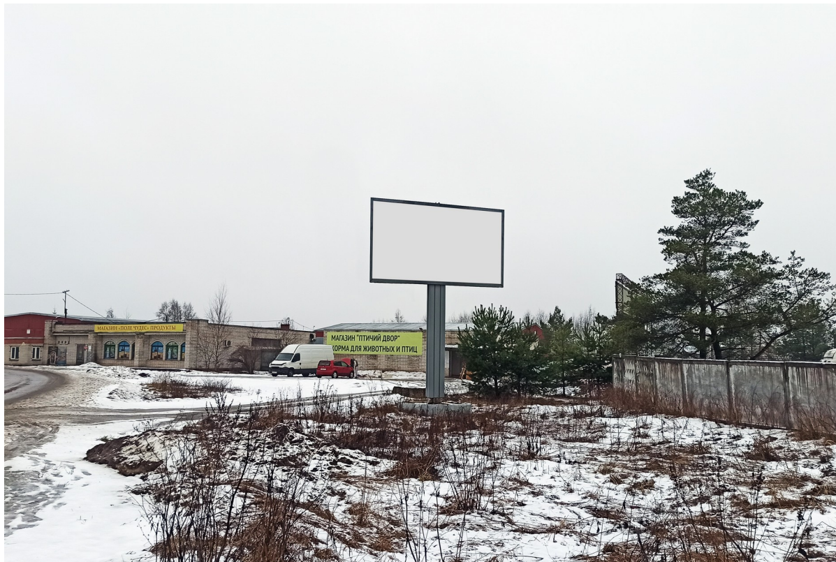
Место расположения рекламной конструкции

двусторонний щит – билборд формата 6,0х3,0 м